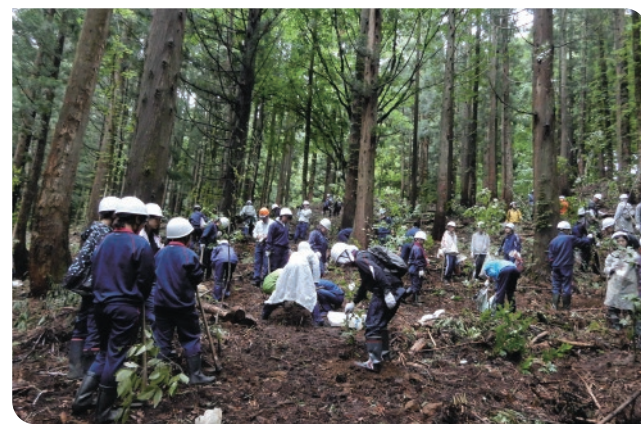
自然環境保全活動 第29回助成 特定非営利法人白神山地を守る会(青森県)