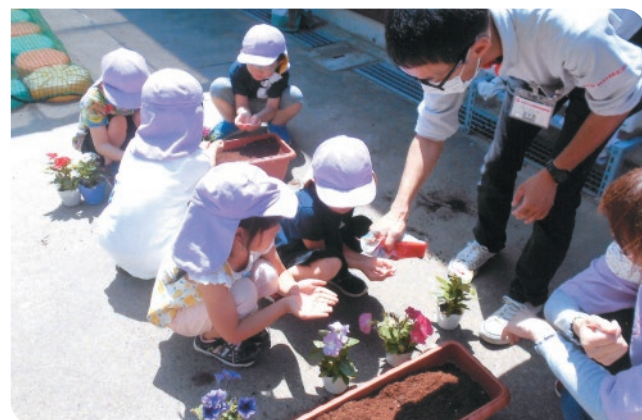
活動先:社会福祉法人ぎんなん保育園 活動店舗:三栄生活館店(新潟県)

1999年にこの活動をはじめ、これまでにのべ2万人近くの従業員がボランティア活動を実施しています。