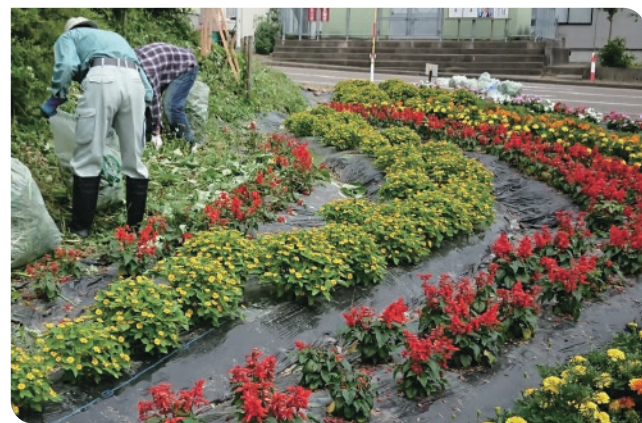
緑化植栽活動 第29回助成 上越市平山町内会(新潟県)

これからお世話になっている地域社会へ感謝の気持ちを込めて、花や緑にあふれた美しいふるさとづくりを応援いたします。