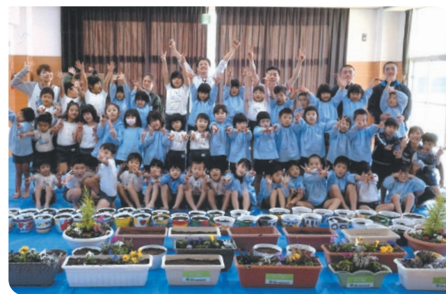
活動先:社会福祉法人松葉福祉会光輪はさみこども園 活動店舗:佐世保店(長崎県)