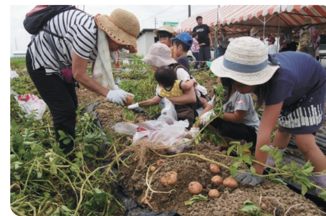
じゃがいも収穫体験

地域の皆さまに参加していただき、地域産業の柱である農業を身近に感じていただくとともに、農業体験を通じて豊かな自然に触れあい、楽しみながら農業を学んでもらう活動です。収穫した農作物は参加者にお持ち帰りいただいております。またコメリ農場の維持管理は、障がいを持つ方の社会参加、自立支援につながることを願い、地元の障がい福祉施設と連携し行っています。